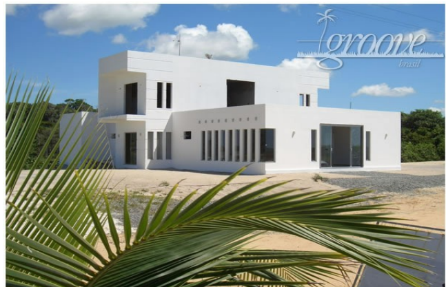
Hier lässt sich's Wohlsein