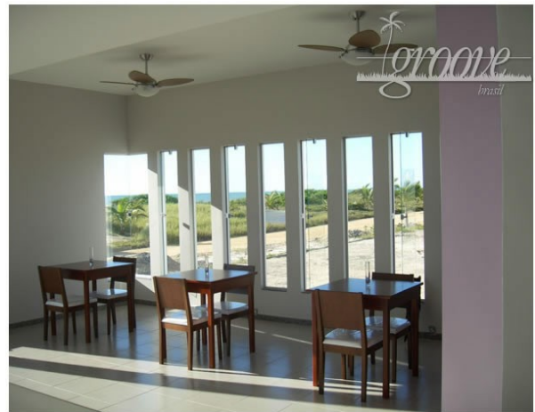
Frühstücksraum mit herrlichem Ausblick ins Grüne

Der Ort ALCOBAÇA liegt im Bundesstaate Bahia und ist mit Privatauto, Omnibus, ja sogar auf dem Flugwege (über Porto Seguro) gut erreichbar.