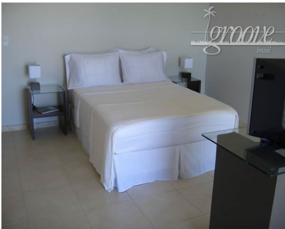
Sauber und mit Stil - die Apartments

Auf gediegende Inneneinrichtung wurde genauso Wert gelegt, wie auch auf deren Bequemlichkeit und Funktionalität.